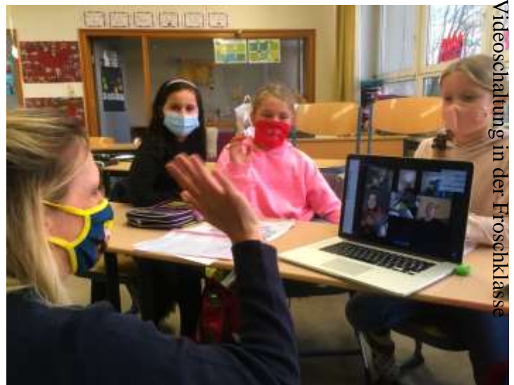
Videoschaltung in der Froschklassse

Umso schöner, dass das Iserv-Angebot so gut durch Sie angenommen wurde. Über 90% aller Eltern sind nun mit ihrem Kind bei Iserv und mit den LehrerInnen schon in Kontakt. Es gab auch schon einige Videoschaltungen in die Klassen.