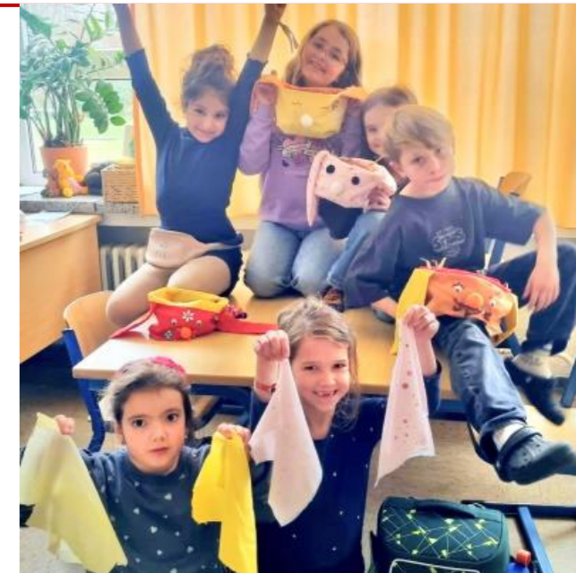
Neu im Ganzttag: NAHEN.

Im Offenen Ganzttag hält der Frühling Einzug. Da wird geschraubt und poliert. Viele Spielsachen können endlich aus dem Winterschlaf geholt werden. Und bald gibt es auch in der Mensa was Neues: Ab 20. April gehen die Kinder nicht mehr unbedingt gleichzeitig essen. Für eine Probezeit bestimmen die Kinder selbst, wann und mit wem sie zum Mittagessen gehen. Also ein wenig wie im Hotel. Beim Essen gelten natürlich die üblichen Regeln. Bei der Brotzeit morgens läuft es schon seit Monaten genauso. Und so soll es nun auch mittags üblich sein. Du kannst mit deiner Klasse essen gehen, kannst aber auch zu einem späteren Zeitpunkt essen. Ob das klappt? Wir probieren es aus!