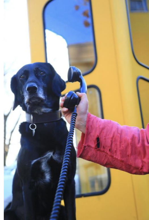
Nicht zum Telefonieren: Bücherkiste

Übrigens: Am 23. April ist Welttag des Buches . In Buchhandlungen gibt es kostenlos kleine Geschichtenbücher. Ein Besuch in Buchläden lohnt aber immer!